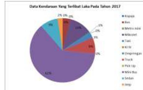
Gambar 1.4 Presentase kecelakaan lalu lintas kendaraan.

transportasi online di Indonesia, penulis menemukan resiko yang dihadapi oleh konsumen dalam menggunakan transportasi online yang berpotensi mengakibatkan adanya kecelakaan atau mendapat kerugian terhadap penumpang atau konsumen pengguna transportasi online tidak lepas dari kelalaian dan tidak terpenuhinya kualitas jasa yang dilakukan oleh driver .