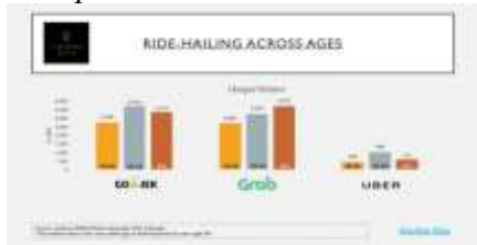
Gambar 1.2 Presentase pengguna aplikasi transportasi online .

Dengan adanya transportasi online menggunakan internet maka banyaknya yang menggunakan transportasi online sehingga adanya suatu masalah yang berkaitan dengan kepastian perlindungan hukum konsumen yang menggunakan transportasi online dari segi aspek, keselamatan, keamanan, kenyamanan, kesetaraan, dan keterjangkauan bagi konsumen. Di dalam Undang-undang Republik Indonesia Nomor 8 Tahun 1999 Tentang perlindungan konsumen, Pasal 1 angka 1 “ Perlindungan konsumen adalah segala upaya yang menjamin adanya kepastian hukum untuk memberi perlindungan kepada konsumen ”.