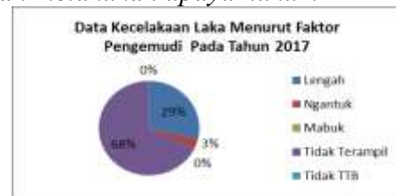
Gambar 1.13 Data Kecelakaan Laka Menurut Faktor Pengemudi Pada Tahun 2017

Berdasarkan hasil wawancara dengan pihak Lembaga Bantuan Hukum Jakarta bahwa konsumen di Indonesia masih lemah “Secara umum konsumen perlindungan konsumen masih lemah, konsumen itu baru terdengar suaranya kalau misalkan masalahnya sudah besar yang menimpa banyak orang kemudian sudah melakukan upaya hukum”.