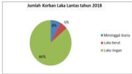
Gambar 1.15 Data jumlah korban Laka Lintas Tahun 2018

Selanjutnya para korban meninggal dunia yang diakibatkan terjadinya kecelakaan kendaraan dengan jumlah korban 43 dengan presentase 8% melihat dari jumlah korban yang meninggal bisa kemungkinan merupakan penumpang atau konsumen pengguna jasa transportasi online seperti bayi Abidzar yang menjadi korban meninggal dunia pada saat menggunakan Go-Car yang merupakan transportasi online , perusahaan penyedia transportasi online sebagai pelaku usaha wajib memberikan uang santunan kepada keluarga korban sesuai dengan kontrak elektronik yang terdapat di aplikasi transportasi online , contohnya bahwa PT.Go-Jek akan memberikan uang santunan musibah kecelakaan kepada pelanggan Go-Jek, konsumen akan menerima penggantian sampai dengan Rp 10.000.000,00. Dalam Pasal 237 ayat (1) Undang-undang No.22 Tahun 2009 tentang Lalu Lintas dan Angkutan Jalan secara tegas mewajibkan “Perusahaan Angkutan Umum wajib mengikuti program asuransi kecelakaan sebagai wujud tanggung jawabnya atas jaminan asuransi bagi korban kecelakaan”.